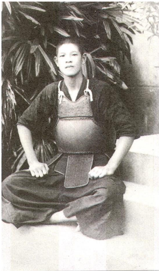
留影於體育館前的李登輝學長

李登輝學長為中華民國首任民選總統，於 1938 年 4 月 1 日至 1941 年 3 月 20 日就讀淡水中學校(今淡江中學)，後越級考取臺北高等學校，名噪一時。其就讀淡中三年期間，品學兼優，尤好劍道。淡江中學體育館建於 1923 年，日人治校期間改為武道館，李登輝學長即在此勤奮練劍，修練武德，並留影於入口台階前。撫今追昔，雖哲人已遠，然照片中李學長身後之棕竹(觀音竹)，今日仍屹立長青，見證我淡江學子，英才輩出，影響台灣歷史深遠。