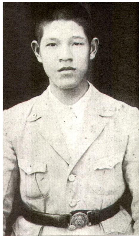
著昔日淡水中學校制服的李登輝學長