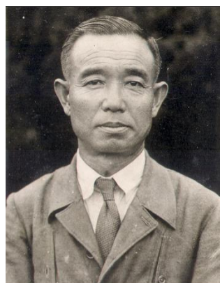
李登輝四年級導師 青野先生

李學長從政後雖位居要職，但對母校的關心不斷，分別於民國 71 年(1982 時任省政府主席)、民國 75 年(1986 時任副總統)、民國 85 年(1996 時任總統)及民國 93 年(2004)，多次回校關心學校發展。