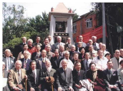
2004 年卸任後的李總統，與當年同學於校慶日時，合影於鐘樓前的「淡中園」。